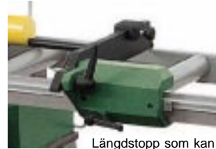
UTMATNINGSBANA MED LÄNGDSTOPP (EXTRA TILLBEHÖR)

Längdstopp som kan positioneras längs med millimeterskalan. Anhållet kan justeras beroende på materialprofil som skall kapas. Enheten kan fällas upp och ned för att underlätta in- och utlastning.