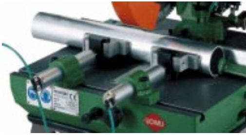
LUFTSKRUVSTYCKE PERRIS 350 MRP