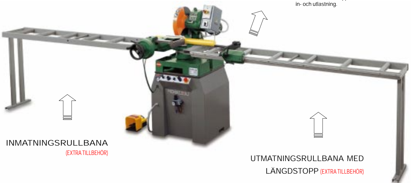
INMATNINGSRULLBANA (EXTRA TILLBEHÖR)

Längdstopp som kan positioneras längs med millimeterskalan. Anhållet kan justeras beroende på materialprofil som skall kapas. Enheten kan fällas upp och ned för att underlätta in- och utlastning.